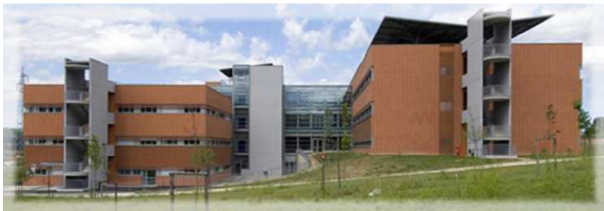
Largo Unità d'Italia, Loc. Branca – 06024 Gubbio (PG)