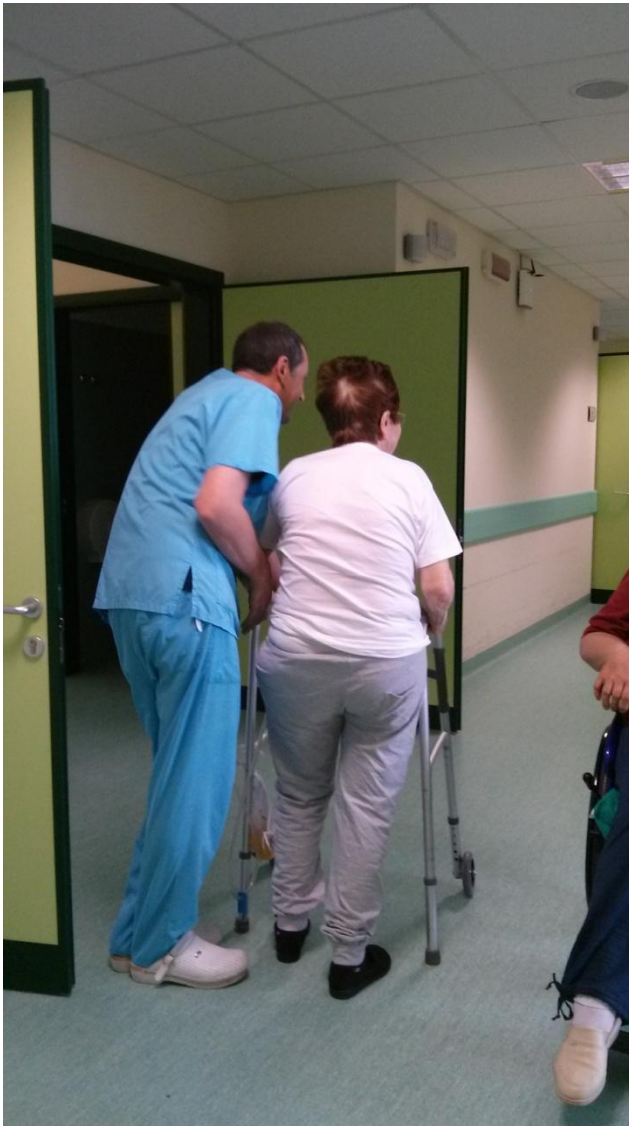
FIGURE PROFESSIONALI CHE OPERANO NEL SERVIZIO